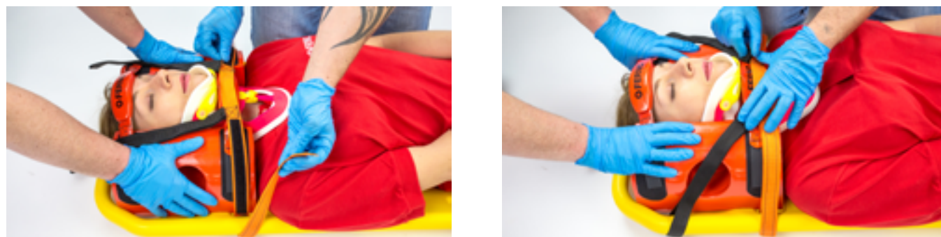
Figura 7 - Applicazione fascia velcro ad "H"