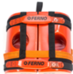
Figura 9 - Configurazione di stoccaggio

Il fermacapo deve essere stoccato pulito in un ambiente interno e asciutto, lontano dalla luce diretta del sole. Quando non viene utilizzato riporlo nella configurazione di stoccaggio (Figura 9).