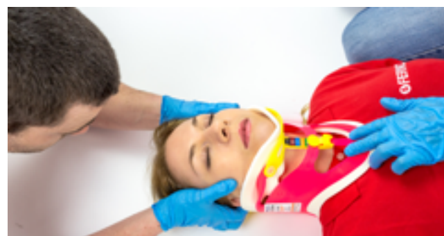
Figura 1 - Collare cervicale applicato

Prima di procedere con l'applicazione del fermacapo, assicurarsi che sia stato applicato correttamente al paziente il collare cervicale (Figura 1). Per l'applicazione del collare cervicale, consultare il relativo manuale d'uso.