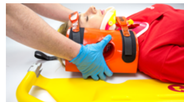
Figura 5 - Pinzare la base fermacapo