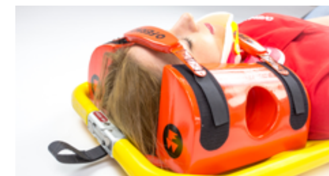
Figura 6 - Caricamento del paziente sulla barella