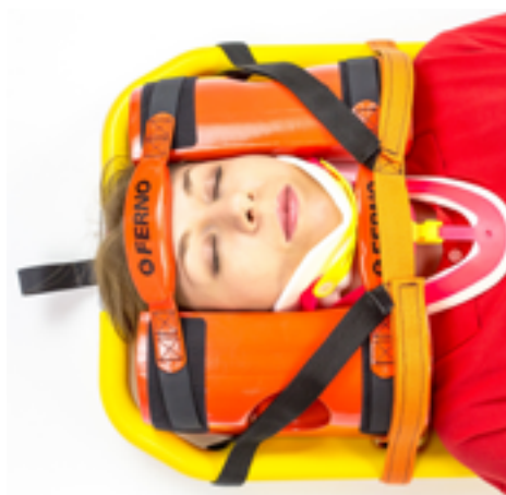
Figura 8 - Fermacapo applicato correttamente con fascia velcro ad "H"